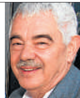
Pasqual Maragall (1941) Alcalde de Barcelona de 1982 a 1997 y presidente de la Generalitat del 2003 al 2006

CEREBRO SANO: las neuronas están conectadas entre ellas a través de redes complejas