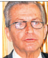
Adolfo Suárez (1932) Presidente de España entre 1976 y 1981