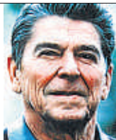
Ronald Reagan (1911-2004) Presidente de EE.UU. entre 1981 y 1989