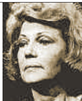
Rita Hayworth (1918-1987) Estrella de Holly- wood, sex symbol en los años 40